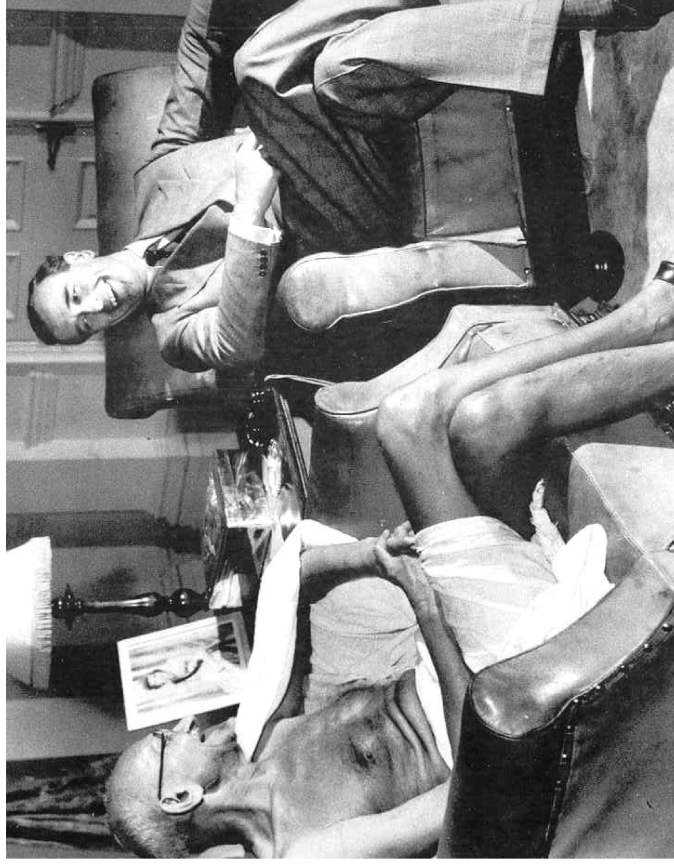
Gandhi, ein treuer Freund des britischen Imperiums bis zum Schluss, trifft sich kurz vor der Unabhängigkeit Indiens 1947 mit Lord Mountbatten, dem Generalgouverneur Indiens.